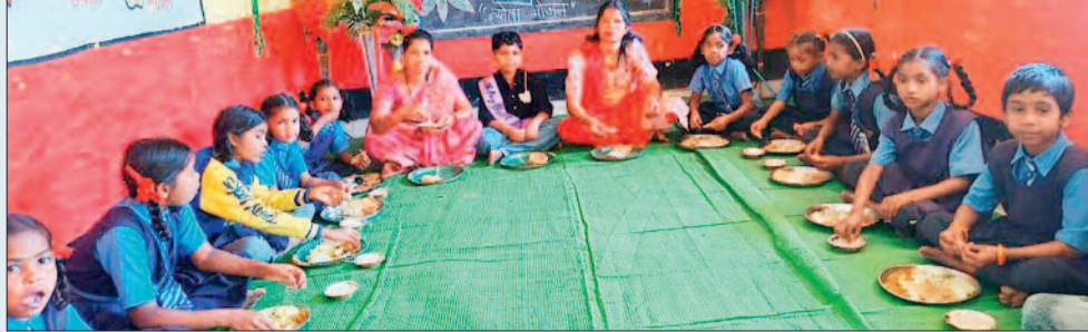
प्रधानमंत्री पोषण शक्ति योजना के तहत अमिनव पहल विद्युत्देव साय की पहल पर शुरू हुए न्योता भोज कार्यक्रम से